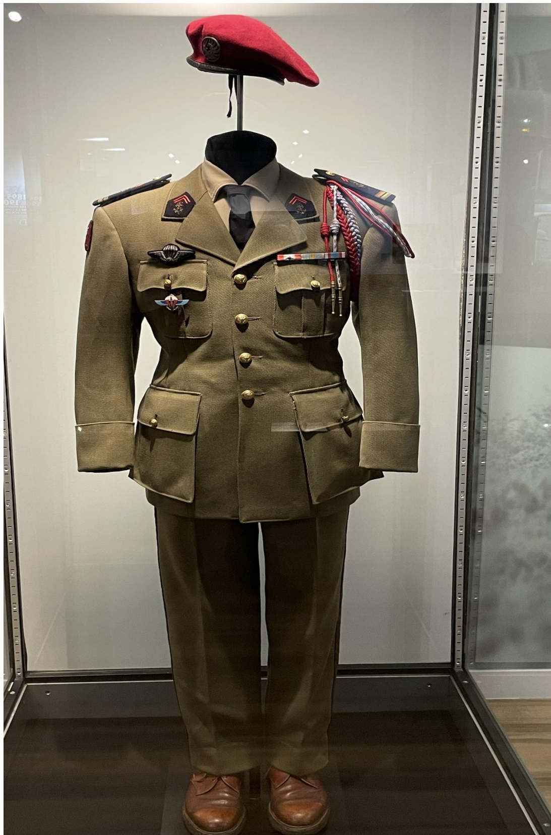
Lieutenant du 2 e Régiment de parachutistes d'infanterie de marine Guerre d'Algérie 1954-1962

Six vitrines couvrent la Grande Guerre de 1914 – 1918. L'exposition coloniale et le défilé du 14 juillet 1931 sont évoqués, par des affiches et reconstitution de défilé en miniature. La seconde guerre mondiale est également représentée, puis les guerres d'Indochine et d'Algérie.